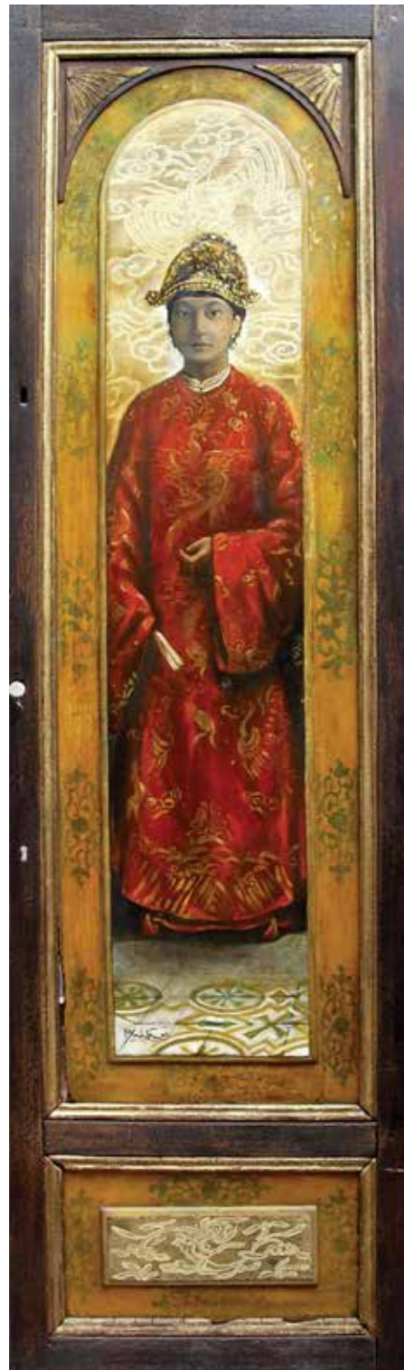
Nam Phương Hoàng Hậu Empress Nam Phuong 2013

Sơn dầu, sơn mài trên gỗ Oil, lacquer on wood