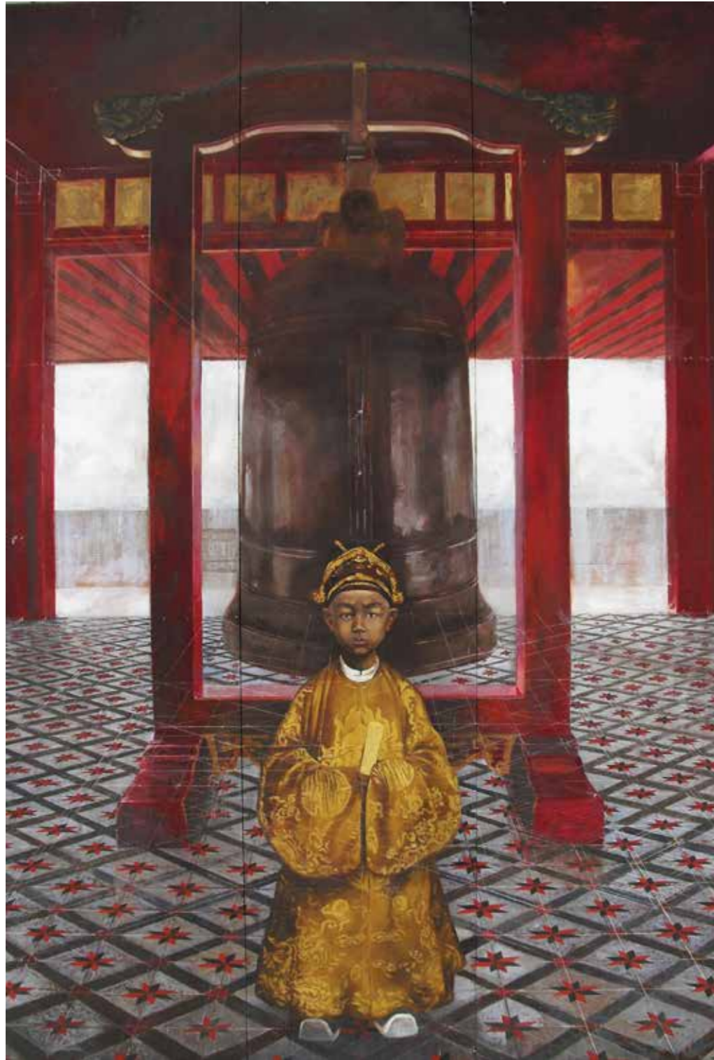
Vua Duy Tân King Duy Tan 2014

Sơn dầu, sơn mài trên gỗ Oil, lacquer on wood