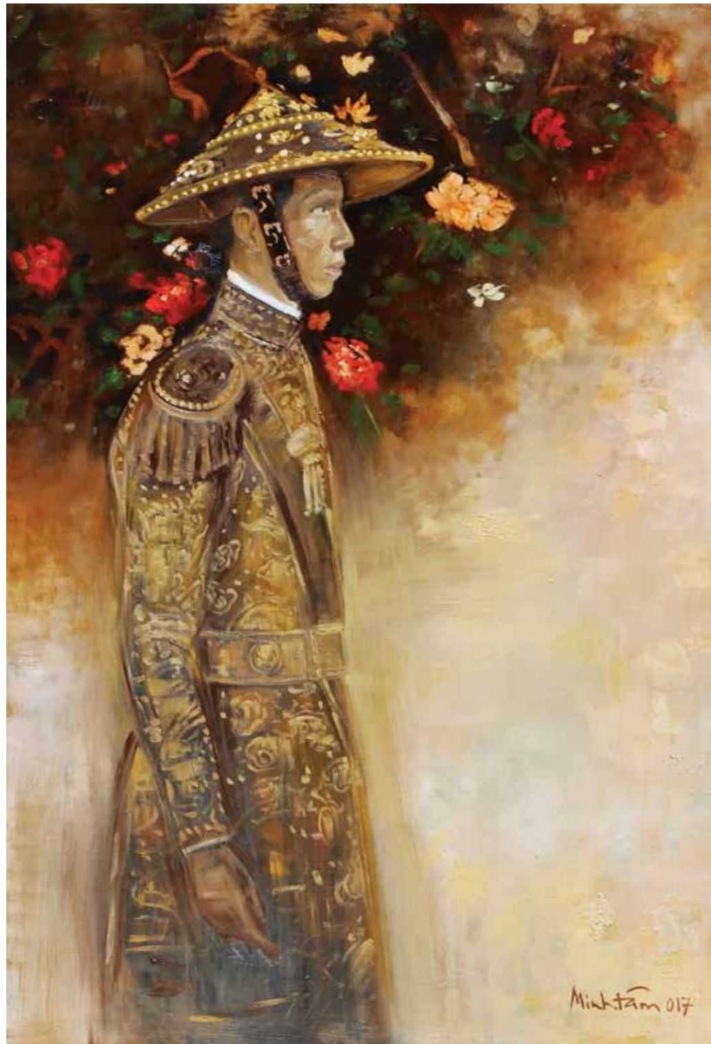
Vua Khải Định King Khai Dinh 2017

Sơn dầu, sơn mài trên gỗ Oil, lacquer on wood