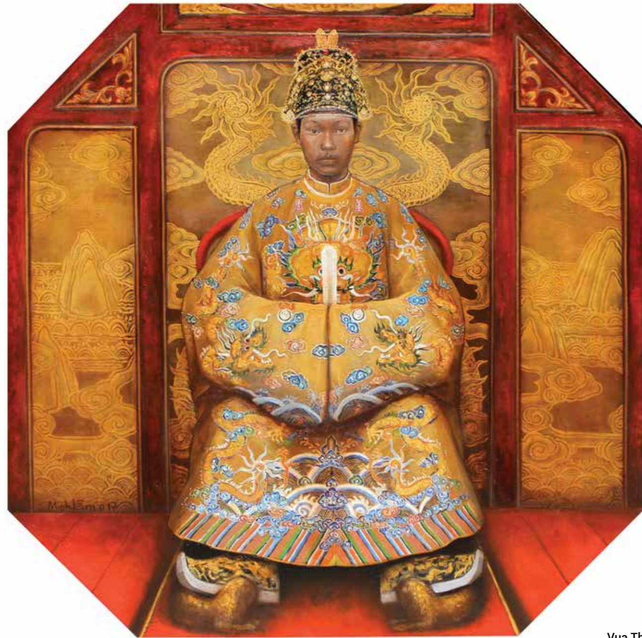
Vua Thành Thái King Thanh Thai 2017

Sơn dầu, sơn mài trên gỗ Oil, lacquer on wood