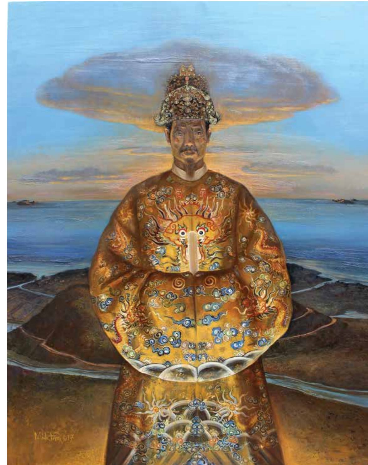
Đức Vua Gia Long King Gia Long 2017

Sơn dầu, sơn mài trên gỗ Oil, lacquer on wood