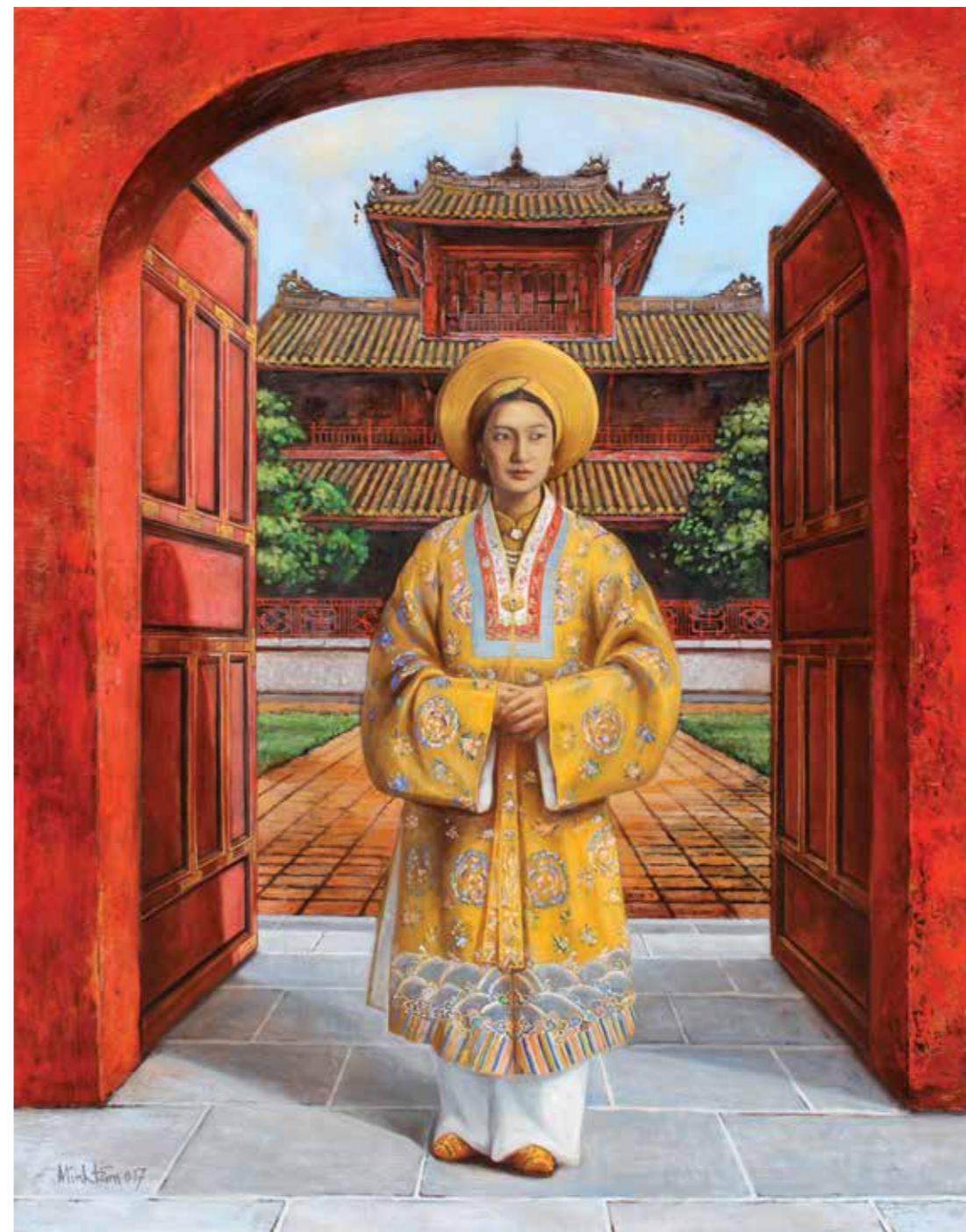
Nam Phương Hoàng Hậu Empress Nam Phuong 2017

Sơn dầu, sơn mài trên gỗ Oil, lacquer on wood