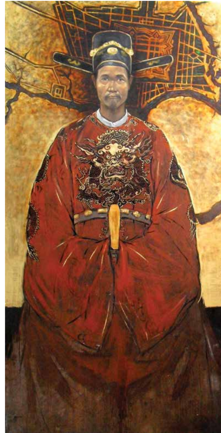
Ông Quan Mandarin 2013

Sơn dầu, sơn mài trên gỗ Oil, lacquer on wood