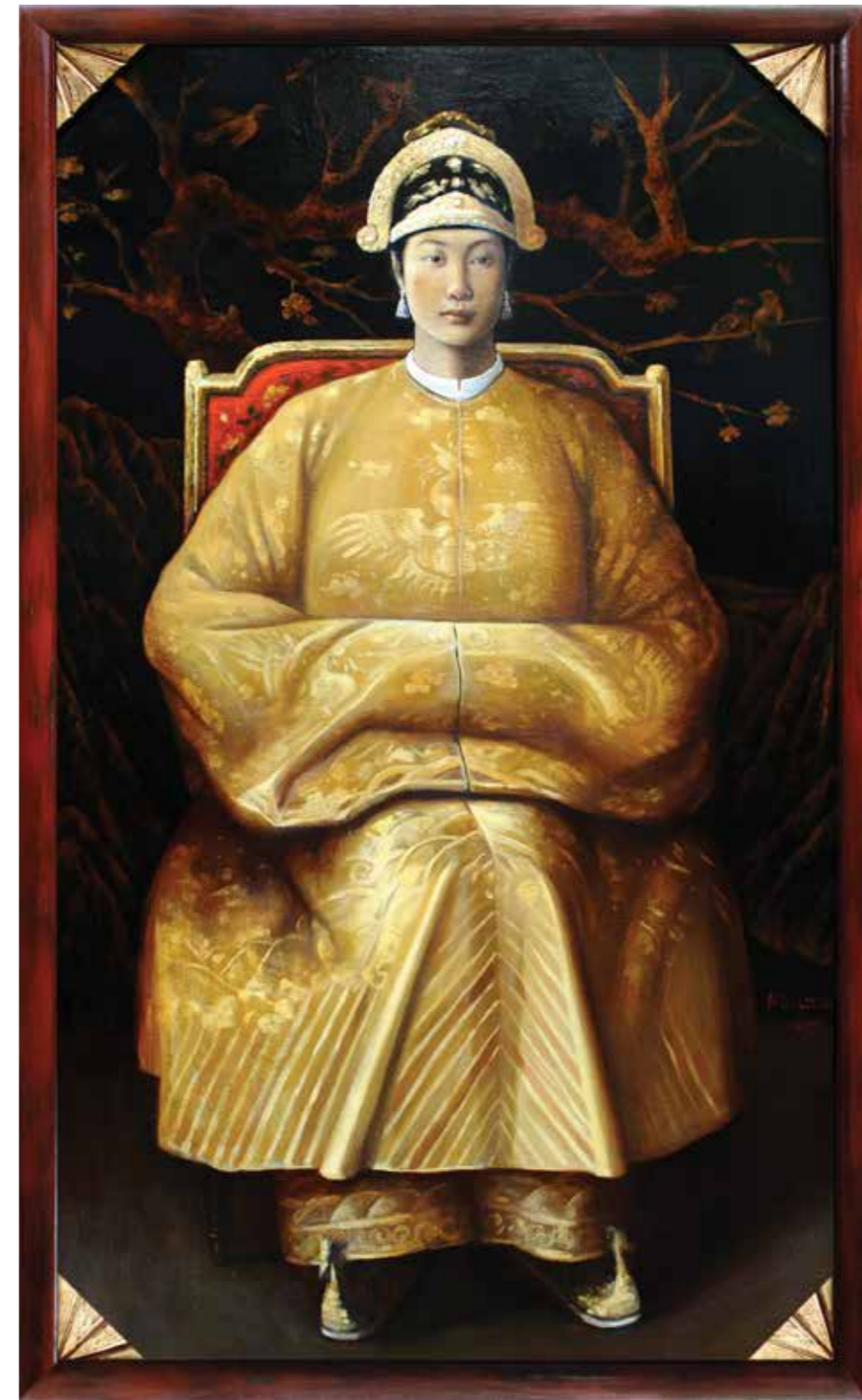
Nam Phương Hoàng Hậu Empress Nam Phuong 2015

Sơn dầu, sơn mài trên gỗ Oil, lacquer on wood