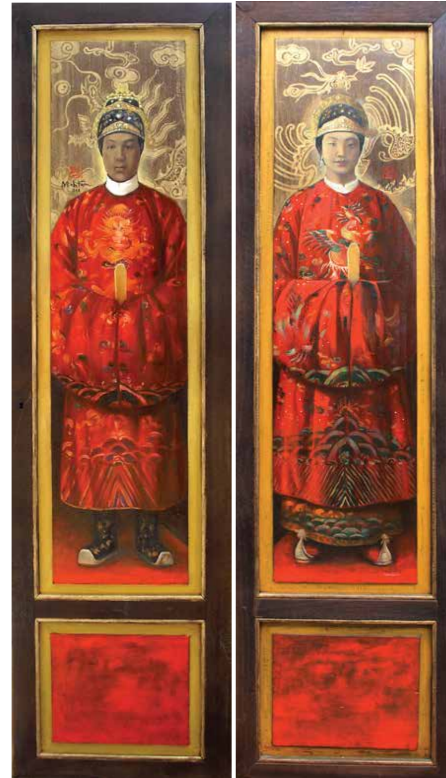
Vua Bảo Đại Ngày Cưới King Bao Dai on His Wedding Day 2014

Sơn dầu, sơn mài trên gỗ Oil, lacquer on wood