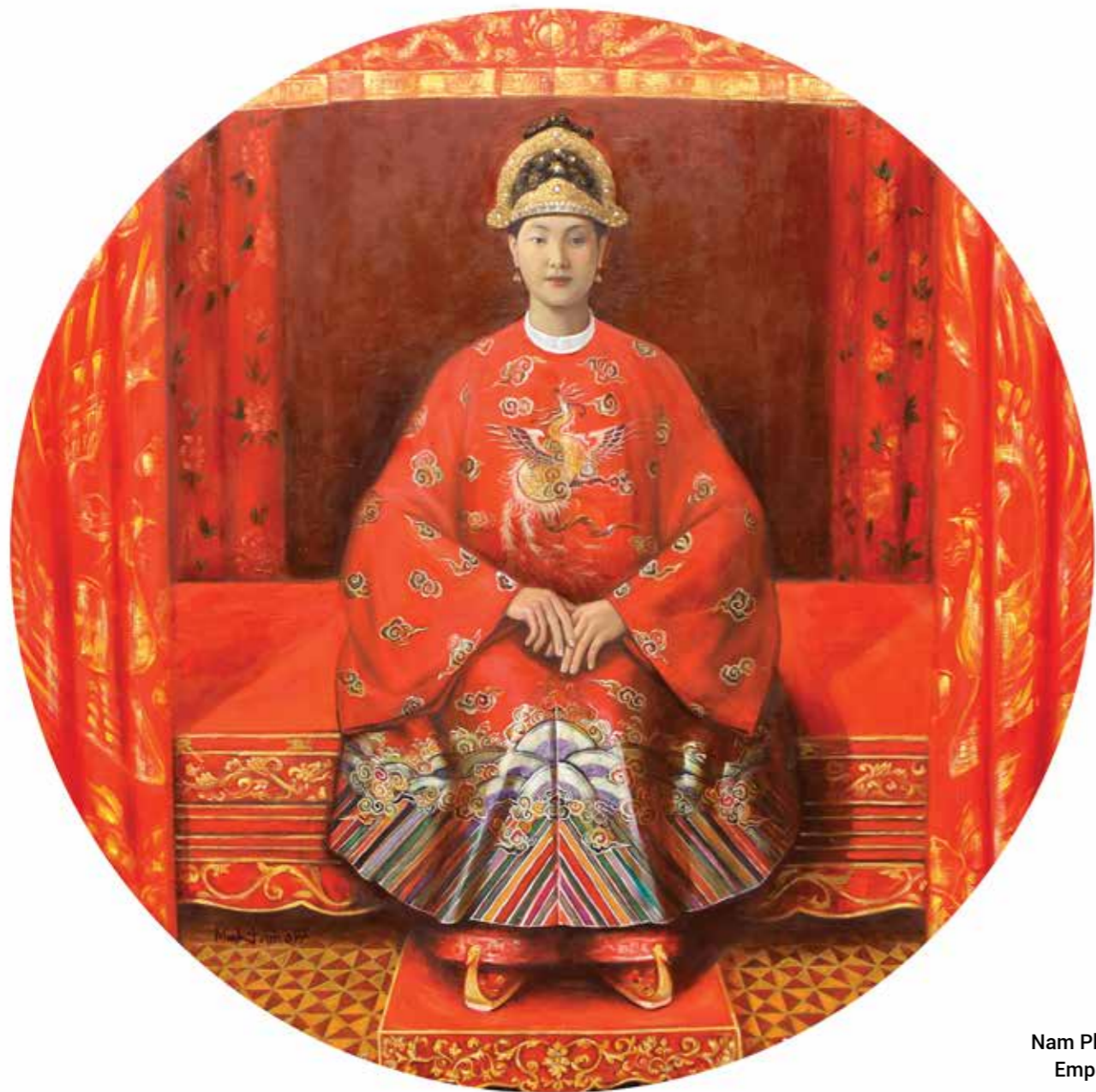
Nam Phương Hoàng Hậu Empress Nam Phuong 2017

Sơn dầu, sơn mài trên gỗ Oil, lacquer on wood