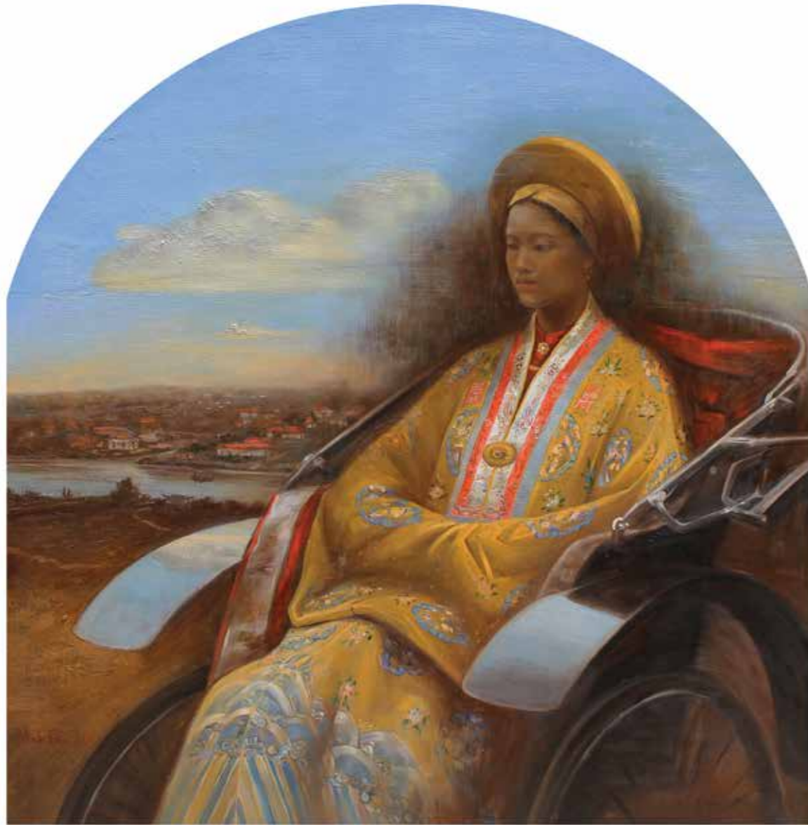
Hùng Đông Breaking Dawn 2017

Sơn dầu, sơn mài trên gỗ Oil, lacquer on wood